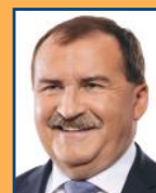
Max Straubinger MdB, CDU/CSU-Bun- destagsfraktion