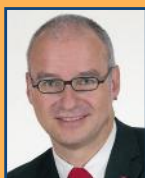
Matthias W. Birkwald MdB, Rentenpol. Sprecher, DIE LINKE.