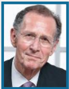
Prof. Dr. Dr. h.c. Bert Rürup Präsident, Handelsblatt Research Institute