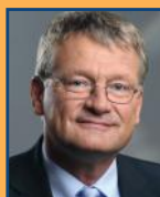
Prof. Dr. Jörg Meuthen MdL, MdEP, Bundes- vors., AfD