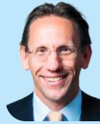
Dr. Jörg Kukies Staatssekretär, Bundesministeri- um der Finanzen

Bundesministerium für Arbeit und Soziales