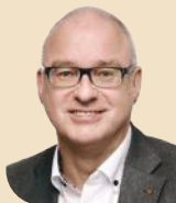
Matthias W. Birkwald Rentenpol. Sprecher, DIE LINKE.-Bundestagsfraktion