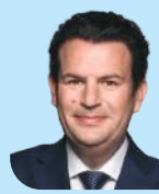
Hubertus Heil Bundesminister, Bundesministeri- um für Arbeit u. Soziales

Bundesministerium für Arbeit und Soziales