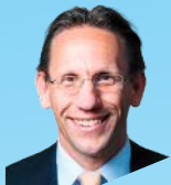
Dr. Jörg Kukies

Staatssekretär, Bundesministerium der Finanzen