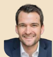
Johannes Vogel Rentenpol. Sprecher, FDP-Bundestagsfraktion