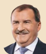
Max Straubinger Rentenpol. Sprecher, CDU/CSU-Bundestagsfraktion