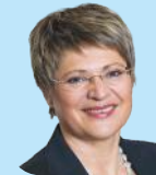
Gundula Roßbach Präsidentin, Deut- sche Rentenversi- cherung Bund