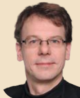
Markus Kurth Rentenpol. Sprecher, BÜNDNIS90/DIE GRÜNEN-Bundestagsfraktion