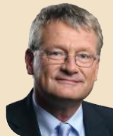
Prof. Dr. Jörg Meuthen MdL, MdEP, Bundesvors., AfD